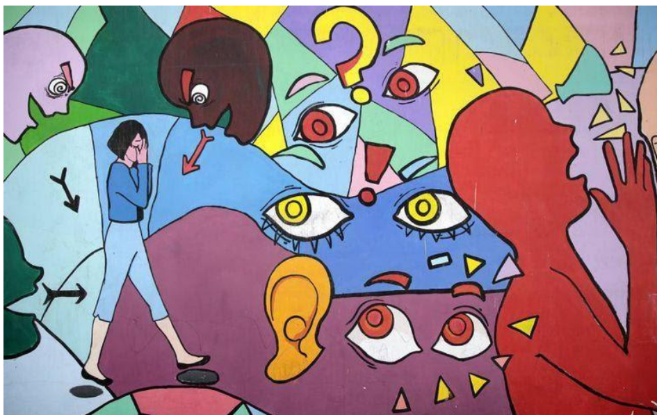
Mural pintado por mujeres en Zona 18, uno de los barrios más violentos de Ciudad de Guatemala.

Los derechos de las mujeres son derechos humanos. Esta afirmación que resulta tan obvia es a menudo ignorada y relegada al papel ante la mirada del sistema internacional. La Organización de las Naciones Unidas (ONU) declara en su Carta de 1945 que la igualdad entre hombres y mujeres es un fundamento básico, aprueba la Convención sobre la eliminación de todas las formas de discriminación contra la mujer en 1979, y la Declaración sobre la eliminación de la violencia contra la mujer en 1993. Sin embargo, pese a que se han llevado a cabo numerosos avances en materia de derechos humanos de la mujer, ningún país puede proclamarse plenamente igualitario en lo que a género respecta. Esa desigualdad deriva a menudo en violencia extrema contra mujeres y niñas y en graves vulneraciones de sus derechos más básicos.